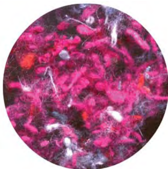
Pasaporte sin Visa • Instalación interactiva De la serie Acicalamientos, No 2 . • 2005